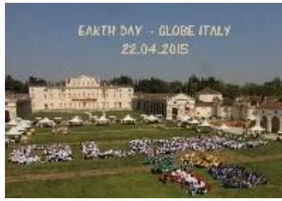
GdT 2015 Villa Manin, Passariano