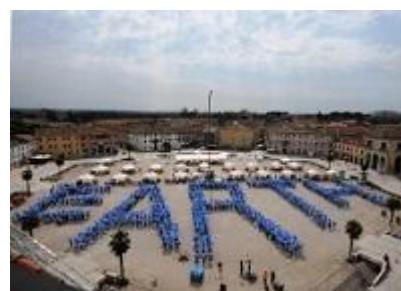
GdT 2013 Palmanova