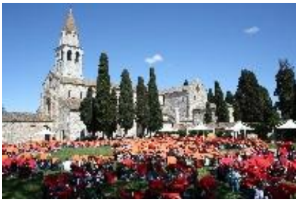
GdT 2014 Aquileia